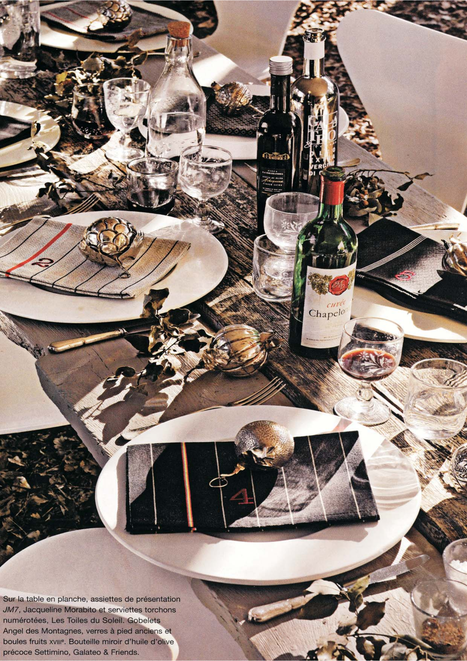
Sur la table en planche, assiettes de présentation JM7, Jacqueline Morabito et serviettes torchons numérotées, Les Toiles du Soleil. Gobelets Angel des Montagnes, verres à pied anciens et boules fruits XVIII e . Bouteille miroir d'huile d'olive précoce Settignano, Galateo & Friends.