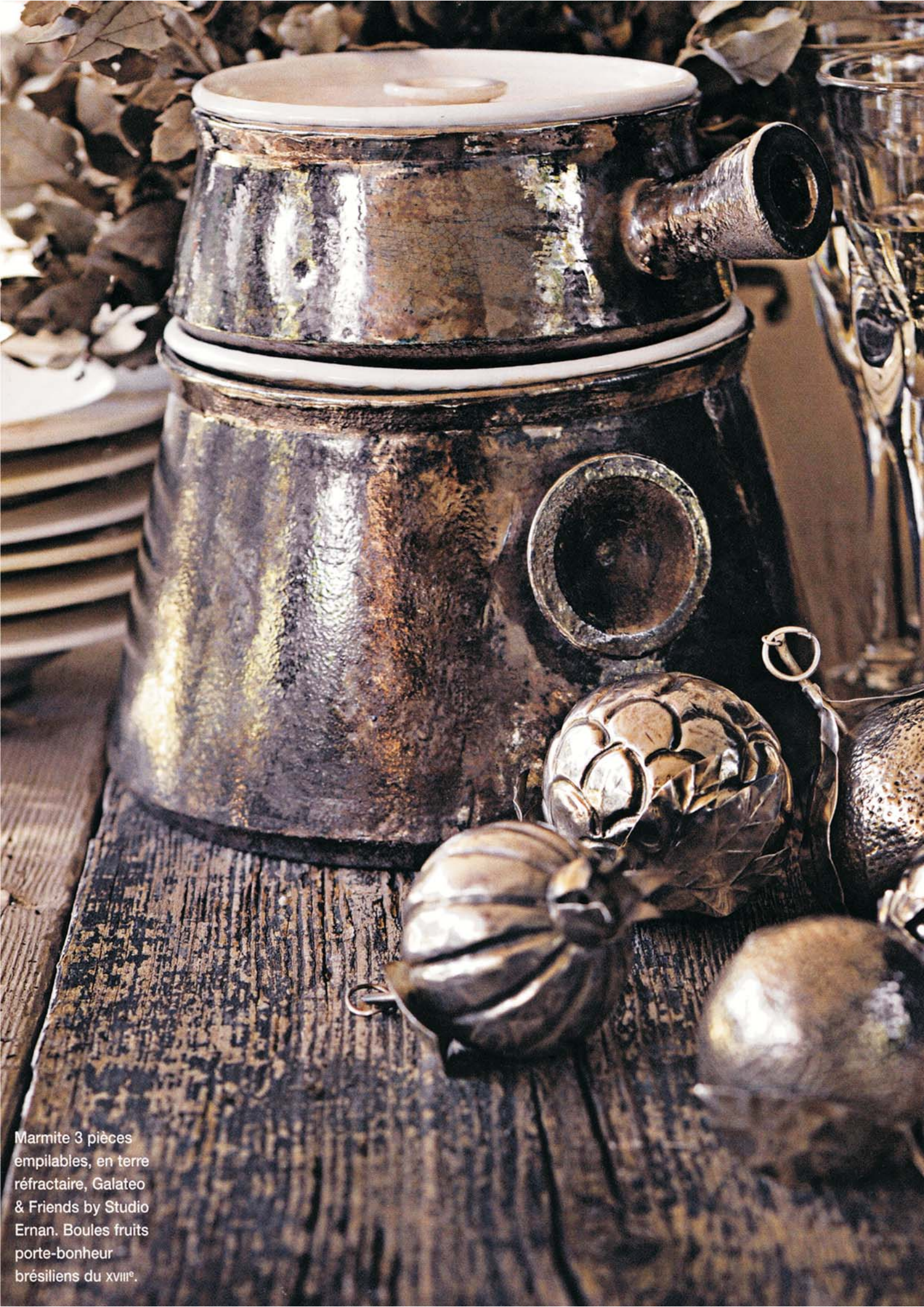
Marmite 3 pièces empilables, en terre réfractaire, Galateo & Friends by Studio Ernan. Boules fruits porte-bonheur brésiliens du XVIII e .